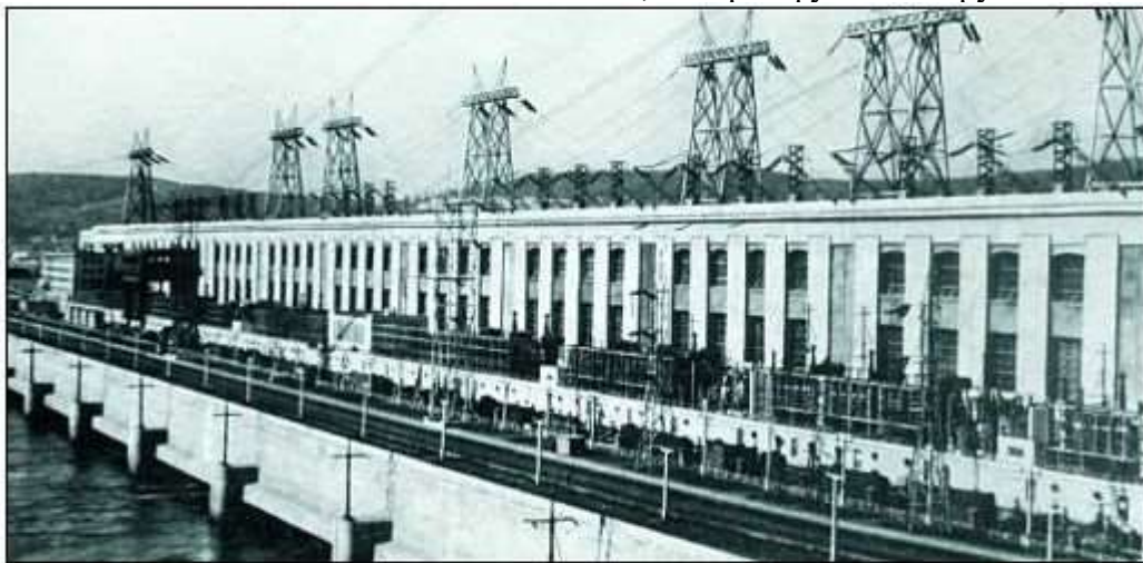
Волховскую ГЭС — первую крупную гидроэлектростанцию, построенную по "ленинскому" плану ГОЭЛРО, — заложили еще в 1910 году

Первенец плана ГОЭЛРО — Волховская ГЭС, которая функционирует и поныне.