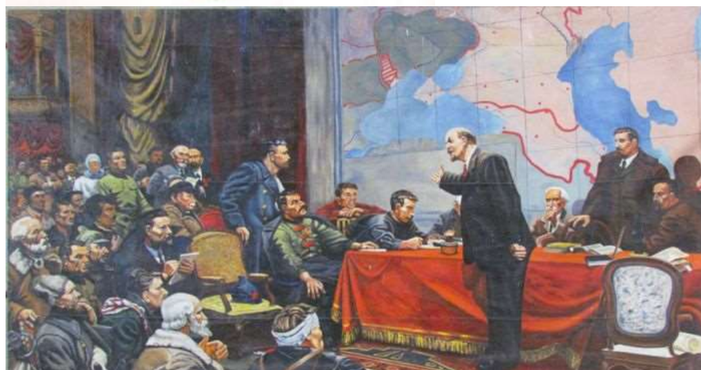
Ленин у карты ГОЭЛРО.

VIII Всероссийский съезд Советов. Декабрь 1920 г. (с картины худ. А. Шматько)